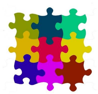
FIGURA 01 – xxxxxxxx.